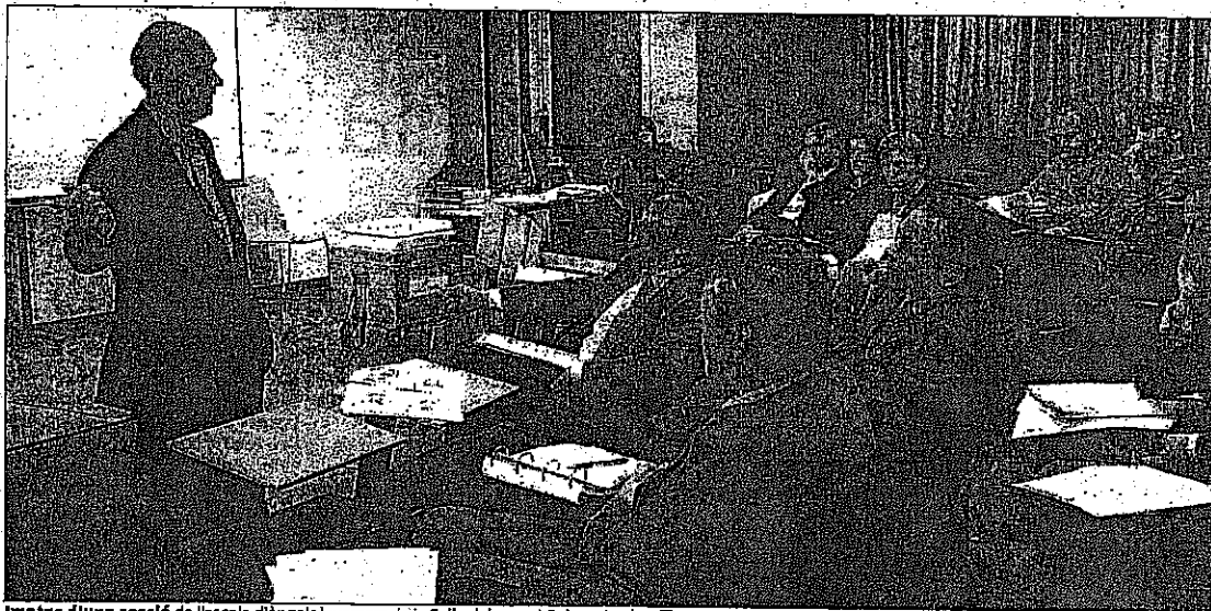
Imatge d'una sessió de l'escola d'àngels inversors de la Salle del passat 9 de novembre.

Malgrat l'augment de potencials inversors, el nombre d'operacions tancades no acaba d'enlairar-se. Segons el Cidem, l'any passat es van dur a terme en el mercat català 21 operacions de àngels inversors, que van aportar un capital de nou milions d'euros. En els pri-