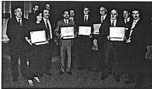
Todos los premiados durante la Nit de la Logística, celebrada el martes

En el transcurso del debate, Nadal pidió la palabra para criticar la actitud del presidente francés, Nicolás Sarkozy, y su proyecto de hacer Francia más impermeable, lo que puede provocar retrasos en la conexión de alta velocidad entre Catalunya y el país vecino. "Hacerse más permeables en su frontera es beneficioso también para Francia y no al contrario. Y, por supuesto, es un error retrasar el enlace entre Figueres y Montpellier", sostuvo. "Es un error la concentración de camiones que hay para pasar la frontera y que colapsa Val d'Aran, la carretera y el túnel de Viella. El transporte por carretera, como ahora, no es la solución", sentenció.