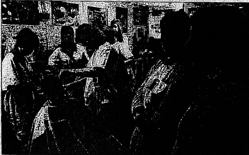
Un grupo de alumnos en una clase de peluquería en el Salón de la Enseñanza.