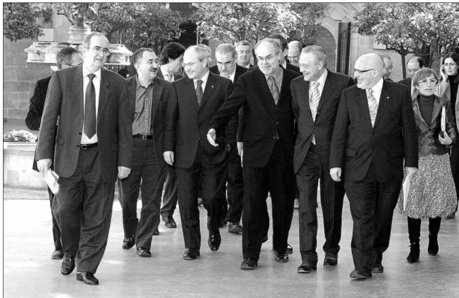
El president, José Montilla, junto a varios consellers y los líderes de las patronales y los sindicatos catalanes, en la reunión de febrero.

Otros puntos del acuerdo no han tenido los mismos resultados. No se ha avanzado en el libro blanco sobre el fracaso escolar y también es un “tema pendiente” la creación de infraestructuras de telecomunicaciones en los polígonos industriales, según reco-