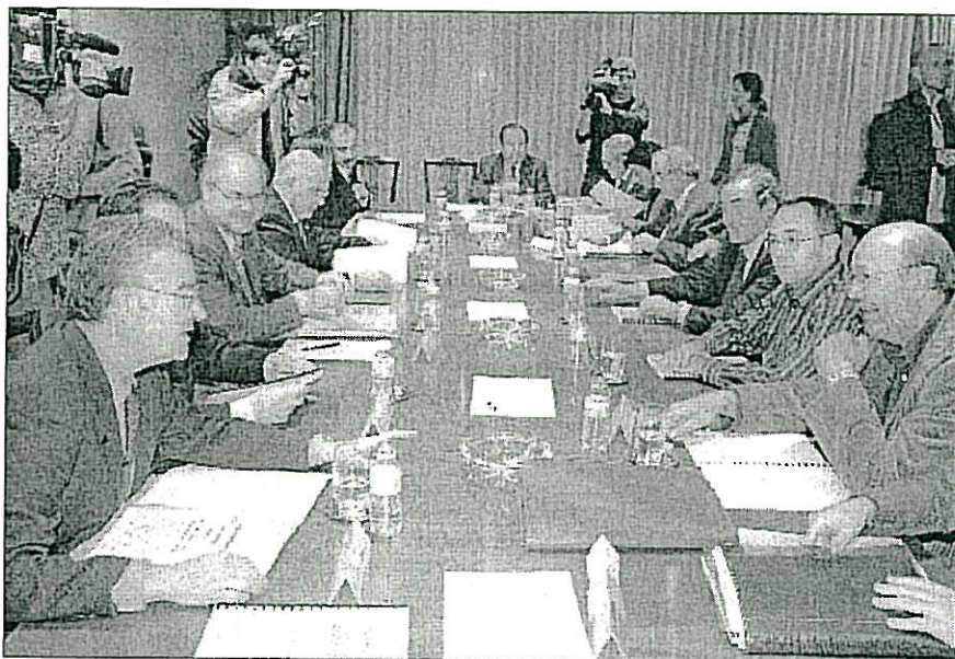
Los firmantes del acuerdo celebraron ayer su última reunión.

Junto a medidas ya en marcha o conocidas, como la construcción de autovías, la mejora de los accesos a los polígonos o el impulso a centros tecnológicos, se añaden otras novedosas, como la creación de un operador conjunto entre Renfe y Ferrocarrils de la Generalitat (FGC) para explotar la línea Lleida-Manresa y Ripoll-